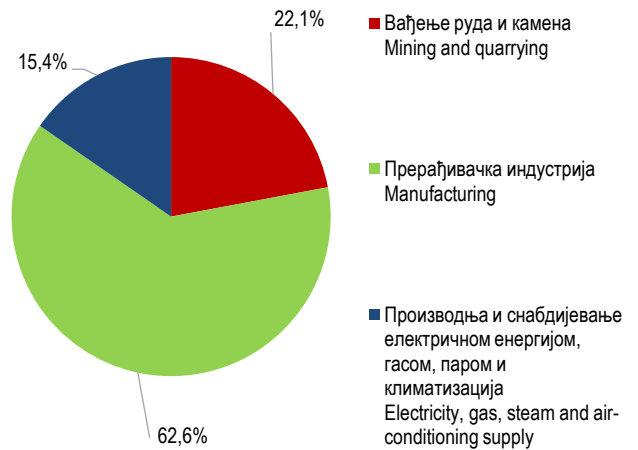
Графикон 2. Испуштене отпадне воде по подручјима, 2017. Graph 2. Discharged waste waters by section, 2017

Саопштење припремила: Славица Јосиповић email: slavica.josipovic@rzs.rs.ba