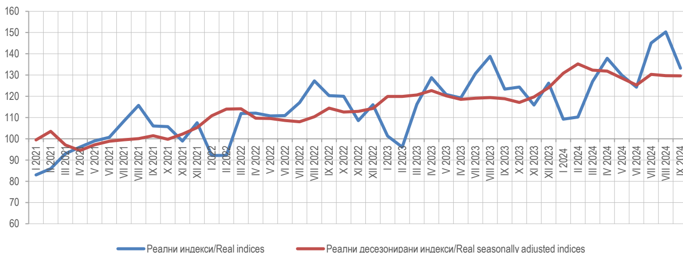
Графикон 1. Серија реалних неприлагођених и реалних десезонираних индекса, 2021=100 Graph 1. Series of real non-adjusted and real seasonally adjusted indices, 2021=100

Turnover refers to the value of goods sold and services performed during the reference month. Turnover does not include value added tax (VAT).