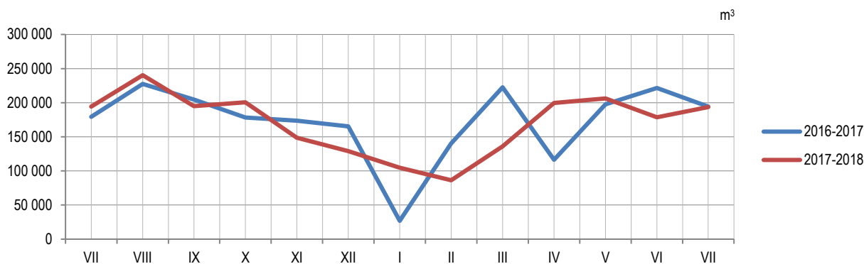
Графикон 1. Производња шумских сортимената у државним шумама по мјесецима Graph 1. Production of forest assortments in state forests by month

Data on production, sale and stocks of forest assortments are obtained through the Monthly report on production of forest assortments (ŠUM–22). This report is submitted by all enterprises from the forestry sector, producing forest assortments from state forests permanently, regardless of production of forest assortments being their main activity or not. Since the beginning of 2002, data on production of forest assortments have been collected according to the Nomenclature of forestry products and services, which is harmonized with the List of characteristic activities of the forestry industry and which was prepared and published by Eurostat – Statistical Office of the European Communities as an integral part of the Manual on Economic Accounts for Agriculture and Forestry, at the end of 1997.