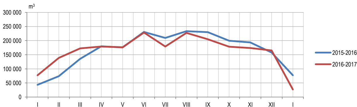
Графикон 1. Производња шумских сортимената у државним шумама по мјесецима Graph 1. Production of forest assortments in state forests by month

Data on production, sale and stocks of forest assortments are obtained through the Monthly report on production of forest assortments (ŠUM–22). This report is submitted by all enterprises from the forestry sector, producing forest assortments from state forests permanently, regardless of production of forest assortments being their main activity or not. Since the beginning of 2002, data on production of forest assortments have been collected according to the Nomenclature of forestry products and services, which is harmonized with the List of characteristic activities of the forestry industry and which was prepared and published by Eurostat – Statistical Office of the European Communities as an integral part of the Manual on Economic Accounts for Agriculture and Forestry, at the end of 1997.