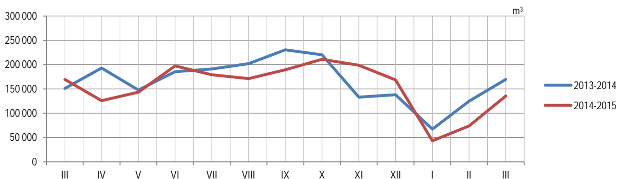
Графикон 1. Производња шумских сортимената у државним шумама по мјесецима Graph 1. Production of forest assortments in state forests by month

Data on production, sale and stocks of forest assortments are obtained through the Monthly report on production of forest assortments (SUM-22). This report is submitted by all enterprises from the forestry sector, producing forest assortments from state forests permanently, regardless of production of forest assortments being their main activity or not. Since the beginning of 2002, data on production of forest assortments have been collected according to the Nomenclature of forestry products and services, which is harmonized with the List of characteristic activities of the forestry industry and which was prepared and published by Eurostat – Statistical Office of the European Communities as an integral part of the Manual on Economic Accounts for Agriculture and Forestry, at the end of 1997.