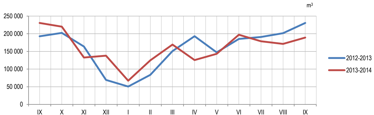
Графикон 1. Производња шумских сортимената у државним шумама по мјесецима Graph 1. Production of forest assortments in state forests by month

Data on production, sale and stocks of forest assortments are obtained through the Monthly report on production of forest assortments (ŠUM–22). This report is submitted by all enterprises from the forestry sector, producing forest assortments from state forests permanently, regardless of production of forest assortments being their main activity or not. Since the beginning of 2002, data on production of forest assortments have been collected according to the Nomenclature of forestry products and services, which is harmonized with the List of characteristic activities of the forestry industry and which was prepared and published by Eurostat – Statistical Office of the European Communities as an integral part of the Manual on Economic Accounts for Agriculture and Forestry, at the end of 1997.