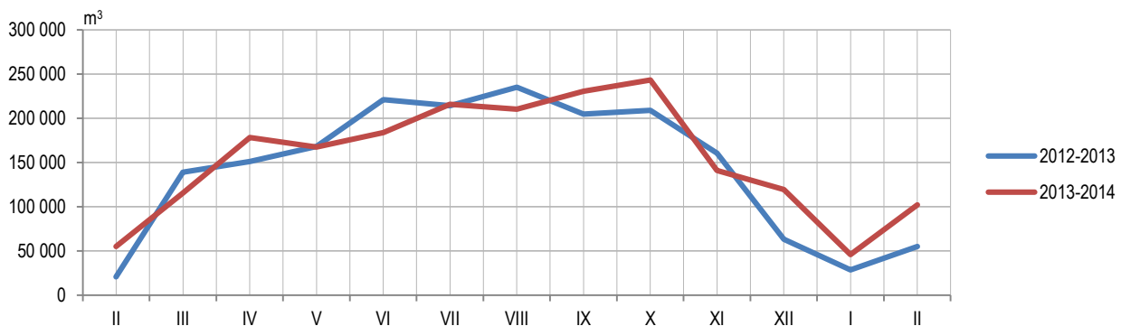
Графикон 2. Продаја шумских сортимената у државним шумама по мјесецима Graph 2. Sale of forest assortments in state forests by month