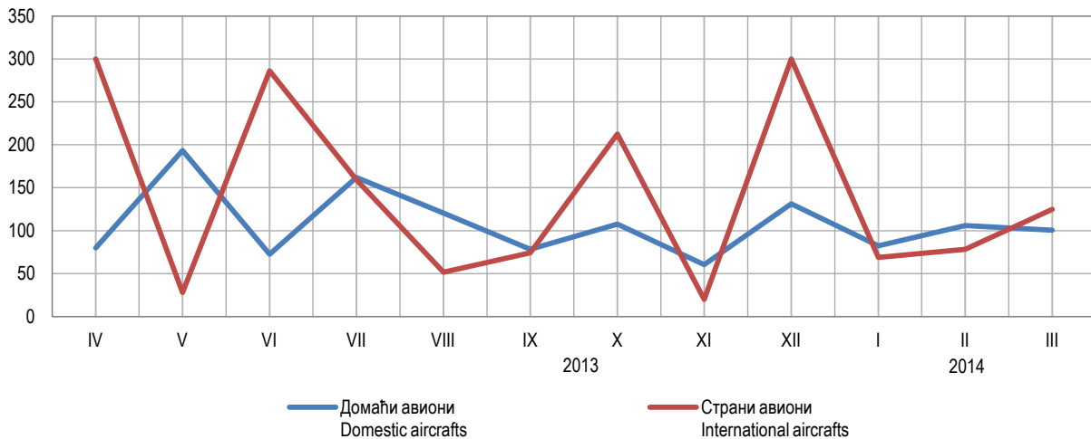
Графикон 3. Промет путника на аеродромима Републике Српске, по мјесецима Graph 3. Passengers at airports of Republika Srpska, by month

1) Промет домаћих авиона обухвата редовне летове BH Airlines, те ванредне летове авиона Владе Републике Српске. Промет страних авиона обухвата летове авиона у власништву приватних компанија. Traffic of domestic aircrafts covers scheduled flights of BH Airlines, as well as exceptional flights of aircrafts owned by the Government of Republika Srpska. Traffic of foreign aircrafts covers flights of aircrafts owned by private companies.