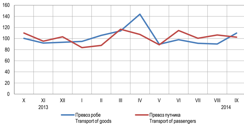
Графикон 1. Превоз робе и путника у друмском саобраћају, по мјесецима Graph 1. Road transport of goods and passengers, by month