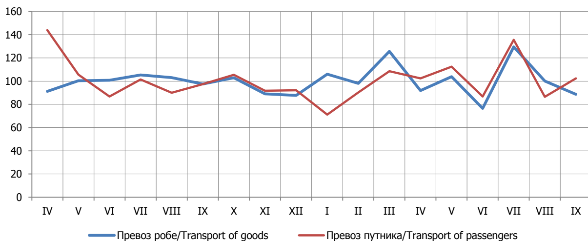
Графикон 2. Превоз робе и путника у жељезничком саобраћају, по мјесецима Graph 2. Railway transport of goods and passengers, by months