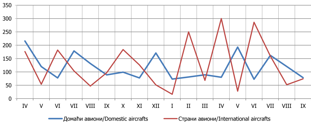
Графикон 1. Промет путника на аеродромима Републике Српске, по мјесецима Graph 1. Passengers at airports of Republika Srpska, by months

1) Промет домаћих авиона обухвата редовне летове ВН Airlines, те ванредне летове авиона Владе Републике Српске. Промет страних авиона обухвата летове авиона у власништву приватних компанија. Traffic of domestic aircrafts covers scheduled flights of BH Airlines, as well as exceptional flights of aircrafts owned by the Government of Republika Srpska. Traffic of foreign aircrafts covers flights of aircrafts owned by private companies.