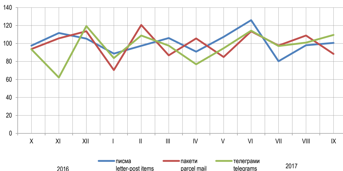
Графикон 1. Поштанске услуге, по мјесецима Graph 1. Postal services, by month