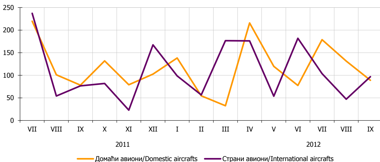
Графикон 2. Промет путника на аеродромима Републике Српске, по тромјесечјима Graph 2. Passengers at airports of Republika Srpska, by quarter

1 Промет домаћих авиона обухвата редовне летове ВН Airlines, те ванредне летове авиона Владе Републике Српске. Промет страних авиона обухвата летове авиона у власништву приватних компанија / Traffic of domestic aircrafts covers scheduled flights of BH Airlines, as well as exceptional flights of aircrafts owned by the Government of Republika Srpska. Traffic of foreign aircrafts covers flights of aircrafts owned by private companies