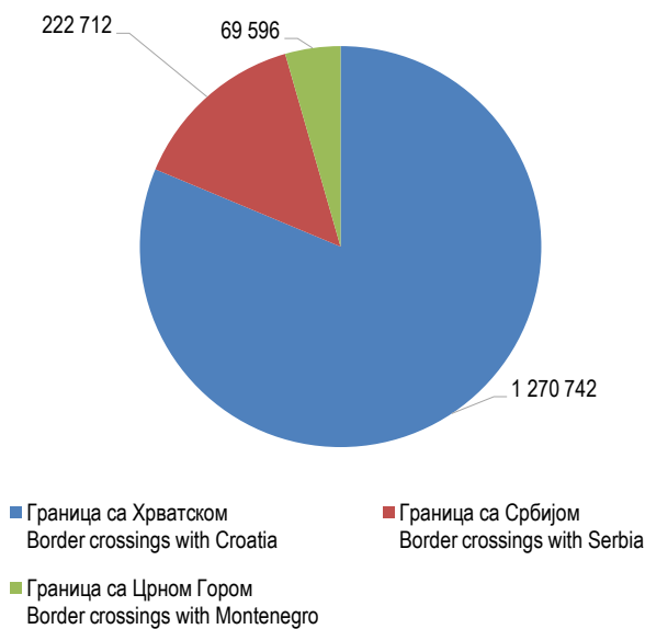
Графикон 1. Гранични промет робе на улазу у Републику Српску Graph 1. Cross-border traffic at the entry to Republika Srpska