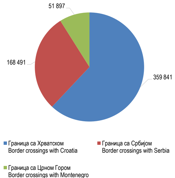
Графикон 2. Гранични промет робе на издазу из Републике Српске Graph 2. Cross-border traffic at the exit from Republika Srpska