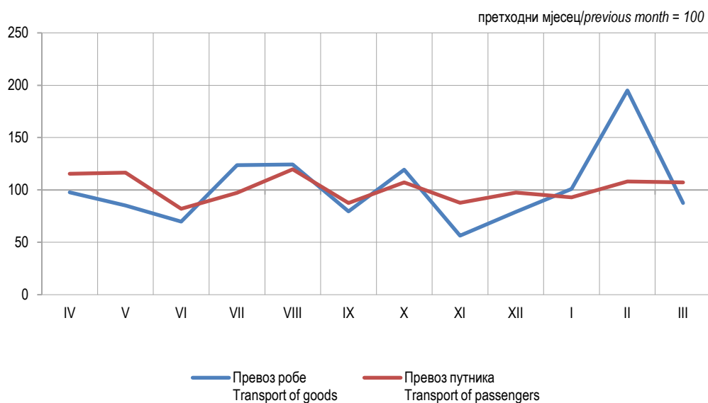
Графикон 2. Мјесечни индекси превоза робе и путника у жељезничком саобраћају, 2024. Graph 2. Monthly indices of railway transport of goods and passengers, 2024