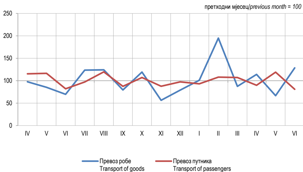
Графикон 2. Мјесечни индекси превоза робе и путника у жељезничком саобраћају, 2024. Graph 2. Monthly indices of railway transport of goods and passengers, 2024