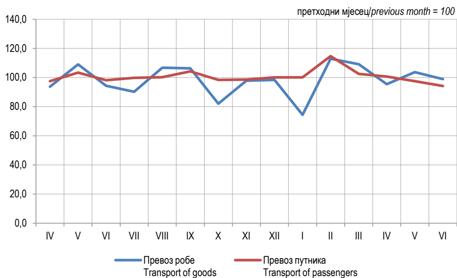
Графикон 1. Мјесечни индекси превоза робе и путника у друмском саобраћају, 2024. Graph 1. Monthly indices of road transport of goods and passengers, 2024