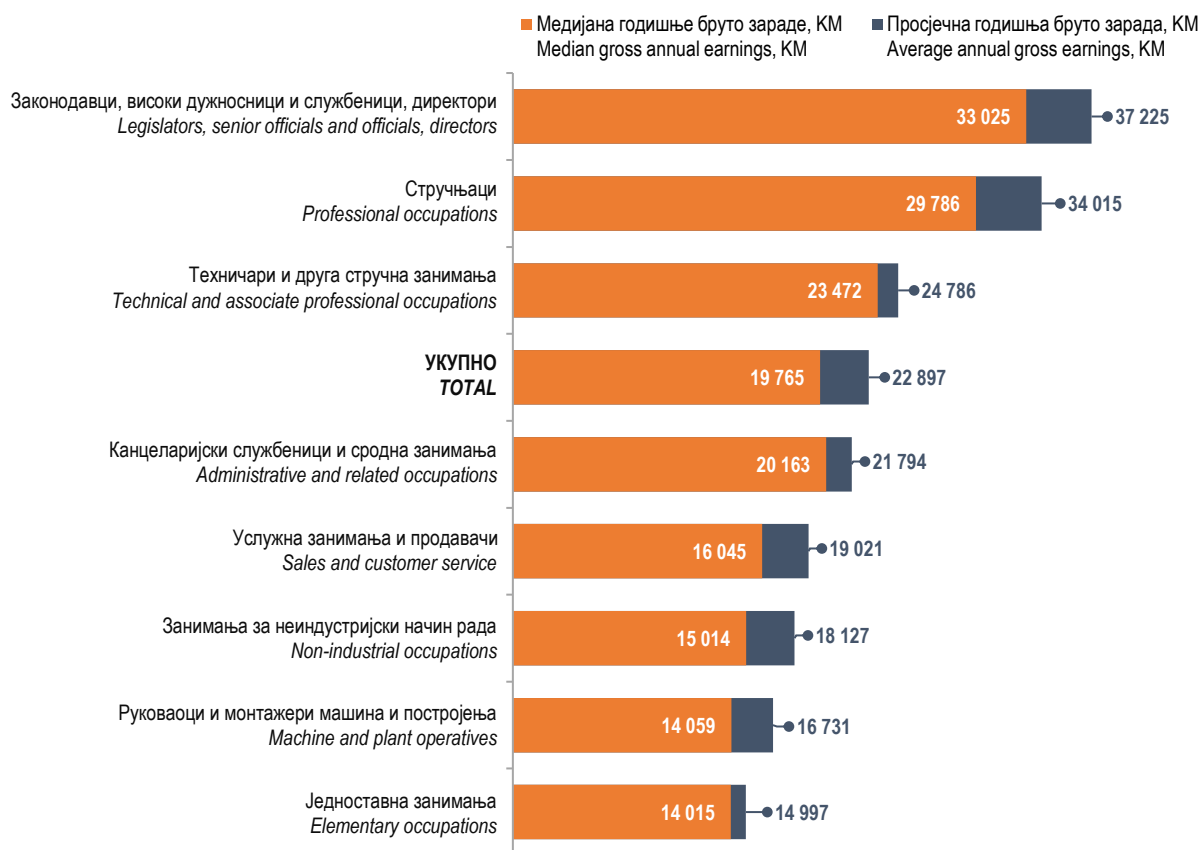
Графикон 2. Годишња бруто зарада према групама занимања, 2022. Graph 2. Annual gross earnings by group of occupations, 2022