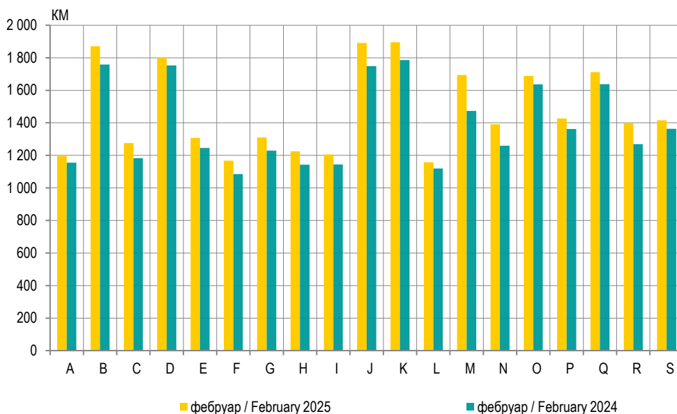
График 1. Просјечне нето плате, по подручјима Graph 1. Average net wages, by section

Nominal index of average net wages is the ratio between nominal amounts of the average net wages in certain observation period. Real index is the ratio between the nominal index of average net wages and the consumer price index in the corresponding period.