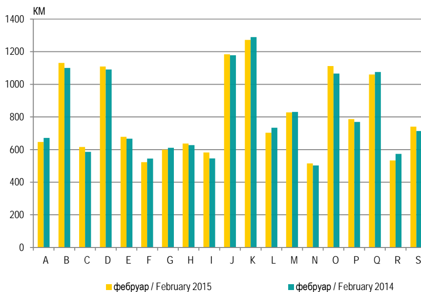
График 1. Просјечне нето плате по подручјима Graph 1. Average net wages by section

Nominal index of average net wages is a ratio between nominal net amounts of the average wages in certain observation period. Real index of average net wages is a ratio between a nominal index of the average net wages per employee and a consumer price index in the corresponding period.