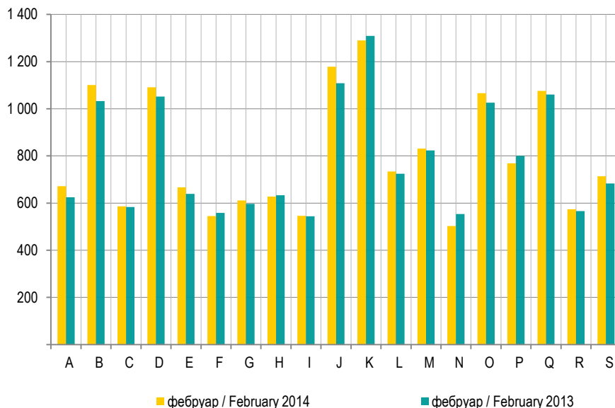
График 1. Просјечне нето плате по подручјима Graph 1. Average net wages by section

Since January 2013, data on average wages have been collected, edited and published by section of activities in accordance with the Classification of Economic Activities KD BiH 2010, which is in its content and structure completely harmonised with the EU Classification of Economic Activities NACE Rev 2.