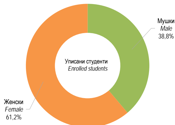
Графикон 2. Уписани студенти према полу у академској 2024/2025. години Graph 2. Enrolled students by sex in the academic year 2024/2025