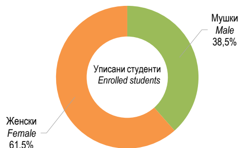
Графикон 2. Уписани студенти према полу у академској 2023/2024. години Graph 2. Enrolled students by sex in the academic year 2023/2024