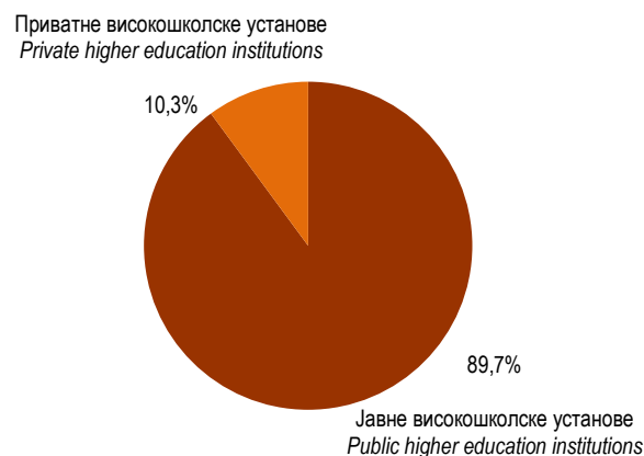
Графикон 2. Докторанти према врсти високошколске установе у 2018/2019. години Graph 2. Doctoral candidates by type of higher education institutions in the academic year 2018/2019