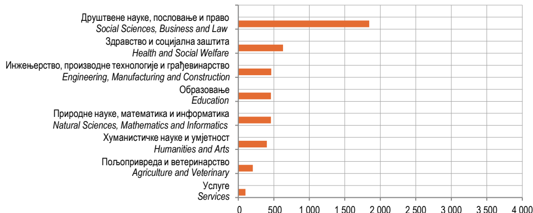
Графикон 3. Дипломирани студенти према области образовања, 2018.

Graph 2. Graduated students by age, 2018