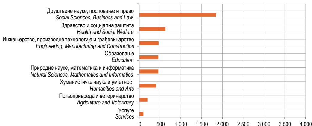
Графикон 3. Дипломирани студенти према области образовања, 2018.

Graph 2. Graduated students by age, 2018