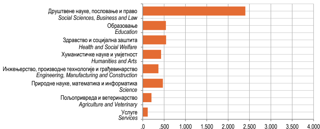
Графикон 3. Дипломирани студенти према области образовања у 2017. години

Graph 2. Graduated students by age, 2017