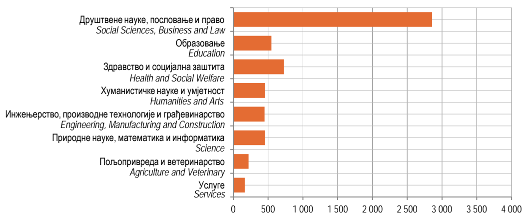
Графикон 3. Дипломирани студенти према области образовања у 2016. години Graph 3. Graduated students by field of study in 2016