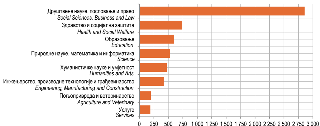
Графикон 3. Дипломирани студенти према области образовања у 2015. години

Graph 2. Graduated students by age in 2015