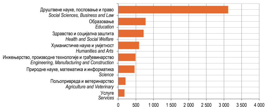
Графикон 3. Дипломирани студенти према области образовања у 2014. години Graph 3. Graduated students by field of study in 2014