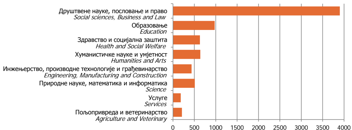
Графикон 3. Дипломирани студенти према области образовања у 2012. години Graph 3. Graduated students by field of study in 2012