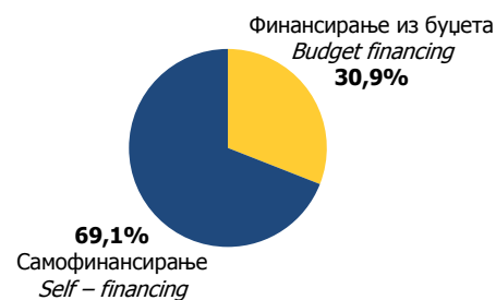
Графикон 3. Студенти према начину финансирања у школској 2010/2011. години Graphic 3. Students by mode of studying in the academic year 2010/2011