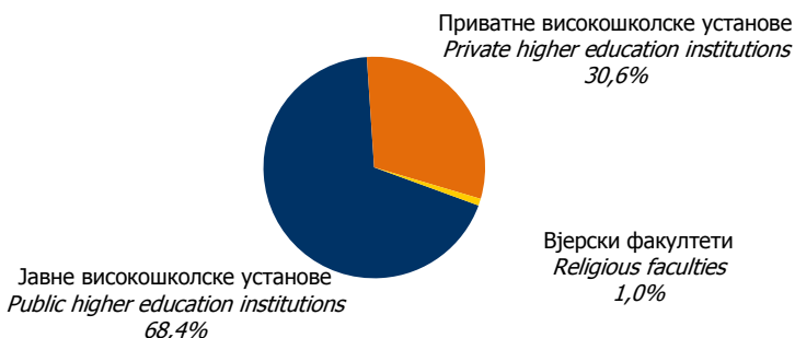
Графикон 2. Студенти према облику својине високошколске установе у школској 2010/2011. години Graphic 2. Enrolled students by type of ownership of higher education institution in the academic year 2010/2011