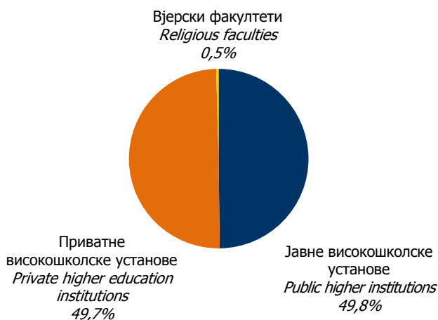
Графикон 1. Дипломирани студенти у 2010. години Graphic 1. Graduated students in 2010

The largest number of graduated students was in Social Sciences (76.3%), then in Technical and Technological Sciences (9.4%), in Medical Sciences (7.4%), in Biotechnical Sciences (3.0%), in Humanities (2.3%) and in Natural Sciences (1.6%).