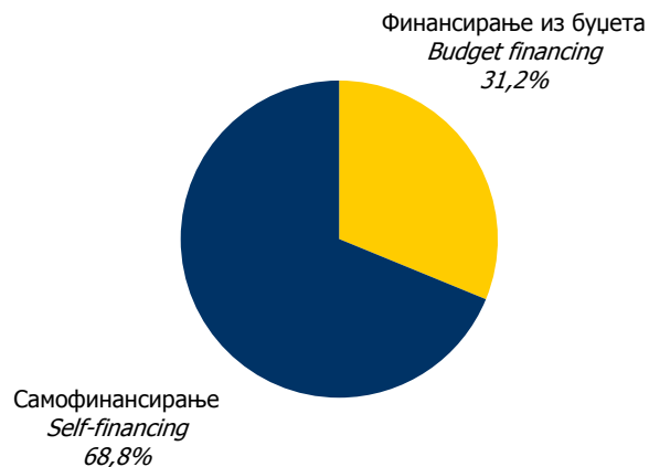
Графика 3. Студенти према начину финансирања у школској 2009/2010. години Graphic 3. Students by mode of studying in the academic year 2009/2010