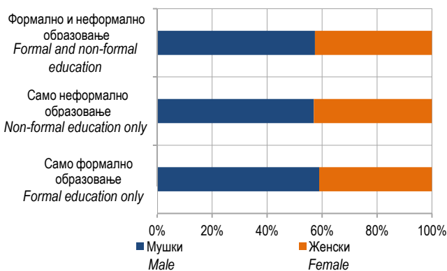
Графикон 2. Одрасли који су учествовали у образовању према полу, 2016–2017. Graph 2. Adults who participated in education by sex, 2016–2017