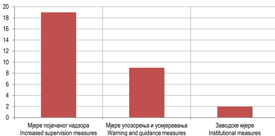
Графикон 2. Изречене кривичне санкције, 2022. Graph 2. Criminal sanctions, 2022