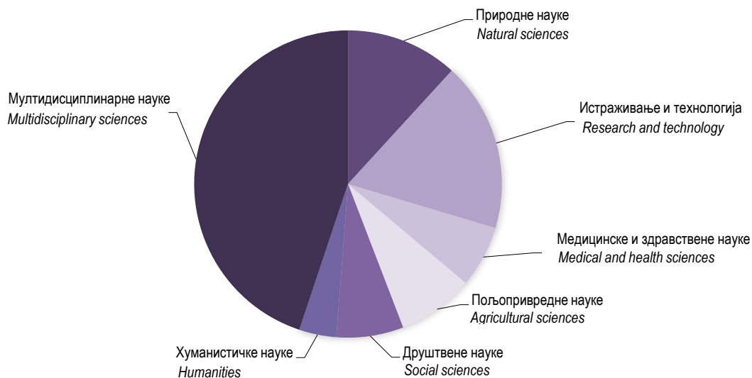
Графикон 2. Буџетска средства намијењена за ИР (стварни издаци), према научној области, 2015. Graph 2. Budget appropriations or outlays for R&D (actual outlays), by field of science, 2015