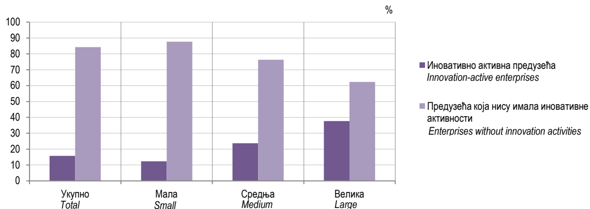
Графикон 1. Предузећа према величини предузећа и иновативној активности, 2020 – 2022. Graph 1. Enterprises by size of enterprise and by innovation activity, 2020 – 2022