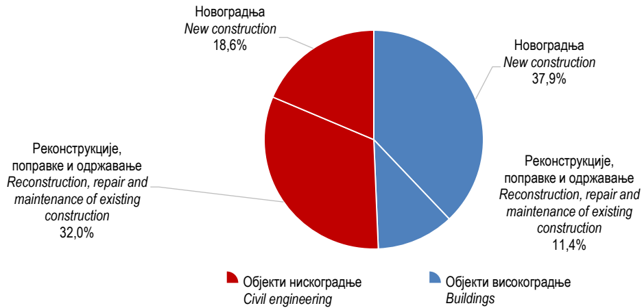
Графикон 2. Структура извршених ефективних часова према врсти радова, IV тромјесечје 2018. Graph 2. Composition of performed effective hours by type of work, 4 th quarter 2018