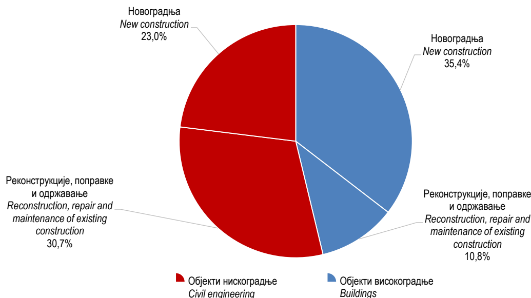
Графикон 2. Структура извршених ефективних часова према врсти радова, II тромјесечеје 2017. Graph 2. Composition of performed effective hours by type of work, 2 nd quarter 2017