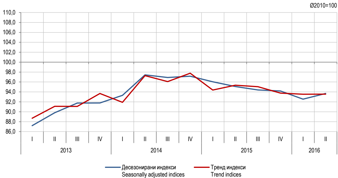
Графикон 1. Индекси производње у грађевинарству, I тромјесечје 2012 – II тромјесечје 2016. Graph 1. Indices of production in construction, 1 st quarter 2012 – 2 nd quarter 2016