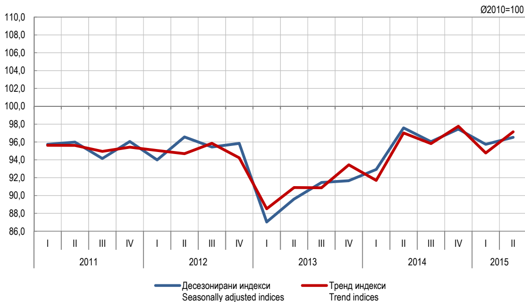
Графикон 1. Индекси производње у грађевинарству, I тромјесечје 2011 – II тромјесечје 2015. (Ø2010=100) Graph 1. Indices of production in construction, 1 st quarter 2011 – 2 nd quarter 2015 (Ø2010=100)