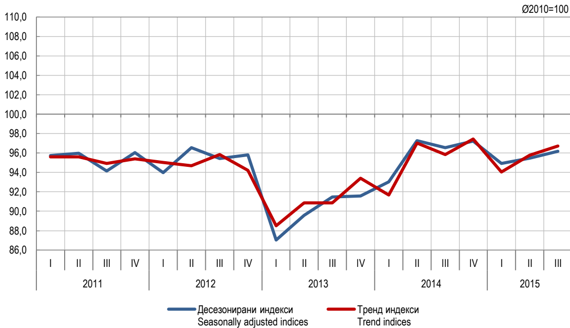
Графикон 1. Индекси производње у грађевинарству, I тромјесечје 2011 – III тромјесечје 2015. (Ø2010=100) Graph 1. Indices of production in construction, 1 st quarter 2011 – 3 rd quarter 2015 (Ø2010=100)