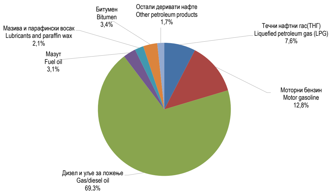
Графикон 1. Енергија расположива за финалну потрошњу, 2023. Graph 1. Energy available for final consumption, 2023