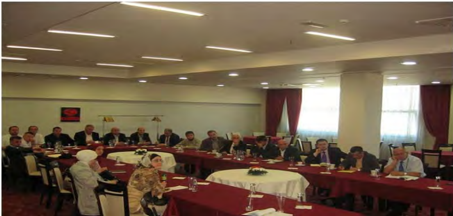
Слика 4. Презентација и тренинг о Попису

Ured muftije zeničkog u saradnji sa Fondacijom "Popis 2013." jučer (15.05) je u Hotelu "Zenica" u Zenici organizirao prezentaciju i trening o predstojećem popisu stanovništva 2013. godine. Prezentacija i trening organizirani su za glavne imame, predsjednike općinskih odbora Ilmiје, predsjednika Okružnog odbora Ilmiје, direktore ustanova Islamske zajednice koje djeluju na području Muftiluka i predsjednike актива вјероучитеља.