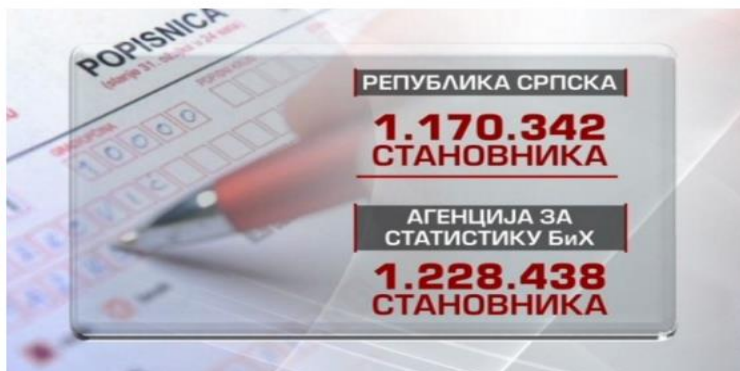
Слика 6. Медији о резултатима Пописа (30. 12. 2016. http://www.atvbl.com/republika-srpska-objavila-svoje-rezultate-popisa/ )