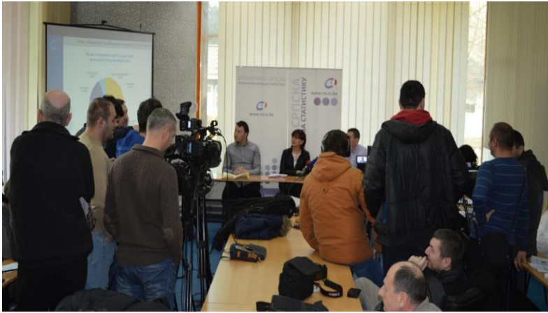
Слика 5. Са представљања резултата Пописа за Републику Српску, 30. 12. 2016.

Иначе, конференцијска сала била је готово премала да прими све медије који су дошли да испрате овај изузетно важан догађај, јер тога дана Република Српска је добила своје податке из Пописа.