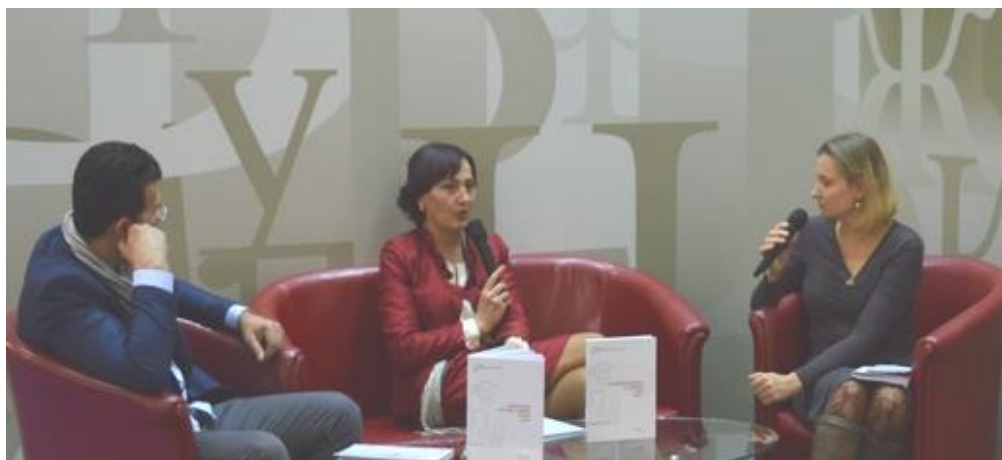
Слика 2. Представљање Отворене књиге на Међународном сајму књиге у Београду