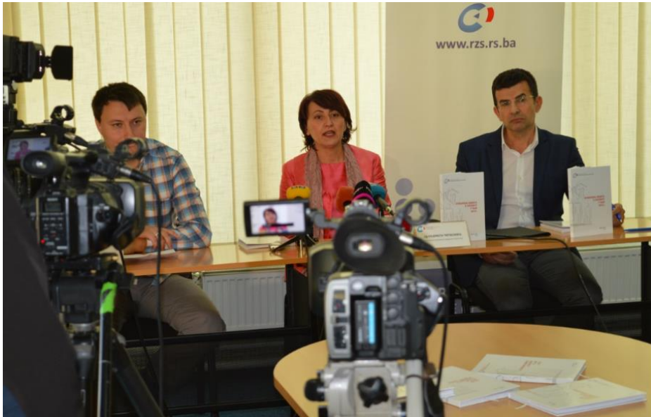
Слика 1. Представљање Отворене књиге јавности

Из тог разлога, Завод је добио афирмативна писма корисника и стручне јавности који су похвалили овакав транспарентан приступ, када су у питању активности у Попису.