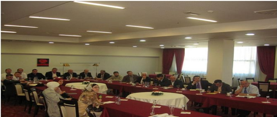
Слика 4. Презентација и тренинг о Попису

Ured muftije zeničkog u saradnji sa Fondacijom "Popis 2013." jučer (15.05) je u Hotelu "Zenica" u Zenici organizirao prezentaciju i trening o predstojećem popisu stanovništva 2013. godine. Prezentacija i trening organizirani su za glavne imame, predsjednike općinskih odbora Ilmiје, predsjednika Okružnog odbora Ilmiје, direktore ustanova Islamske zajednice koje djeluju na području Muftiluka i predsjednike актива vjeroučitelja.