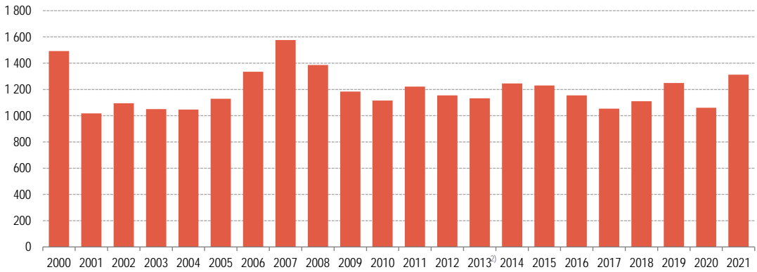
Г-4.1. Број основаних пословних субјеката по годинама 1) Number of established business entities by year 1)

1) Правни субјекти са сједиштем у Брчко дистрикту искључени су од 2002. године из Регистра пословних субјеката. Since 2002, legal entities with headquarters in Brčko District are excluded from the Register of business entities.