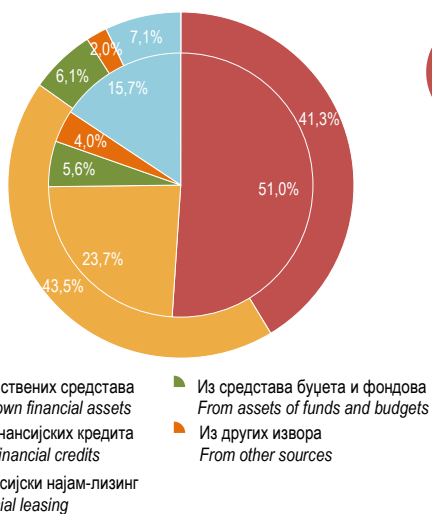
Г-11.3. Исплате за инвестиције по основним изворима финансирања у 2005. и 2014. Financing of gross fixed capital formation by main sources in 2005 and 2014