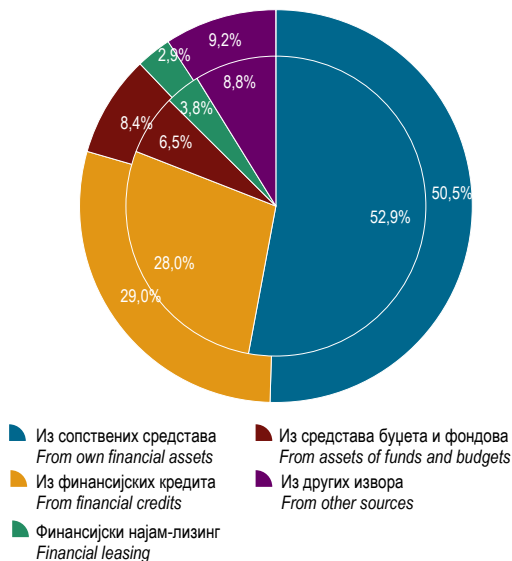
Г-10.3. Исплате за инвестиције по основним изворима финансирања у 2004. и 2010. Financing of gross fixed capital formation by main sources in 2004 and 2010